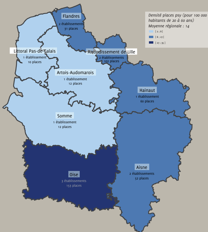
Carte 1. Densités de places pour personnes adultes présentant un handicap psychique en Mas et EAM. Pour 100 000 habitants de 20-60 ans. 2020.

La densité moyenne d'EAM et de Mas s'élève à 10 places pour 100 000 habitants de 20-60 ans ; les valeurs les plus faibles sont enregistrées dans le Pas-de-Calais (2 dans l'Artois-Audomarois et 3 sur le Littoral), la plus élevée dans l'Oise (153 places, soit 25 pour 100 000), suivie de l'Aisne, dont la densité est cependant près de 2 fois inférieure (13). En complément de cette offre médico-sociale pour l'hébergement, des dispositifs d'habitat inclusif [1] se créeront en 2021, faisant suite aux appels à projets de l'ARS ; leur financement sera complété par les Départements 5 . Ils concerneront un public en situation de handicap quel qu'il soit, ou âgé. Déjà présents essentiellement dans le Nord, il s'avère difficile de comptabiliser les personnes en situation de handicap psychique bénéficiant de ce dispositif.