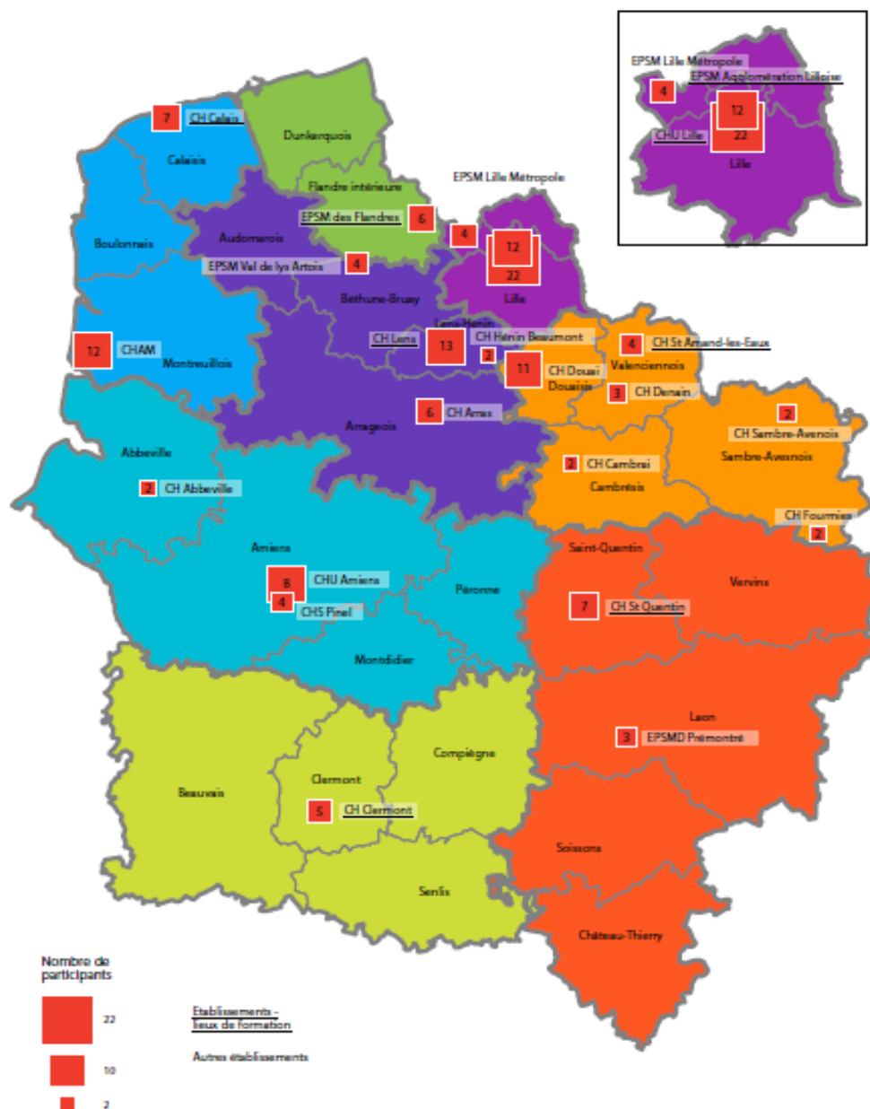
Figure 2 : Localisation des établissements participants et nombre de professionnels formés