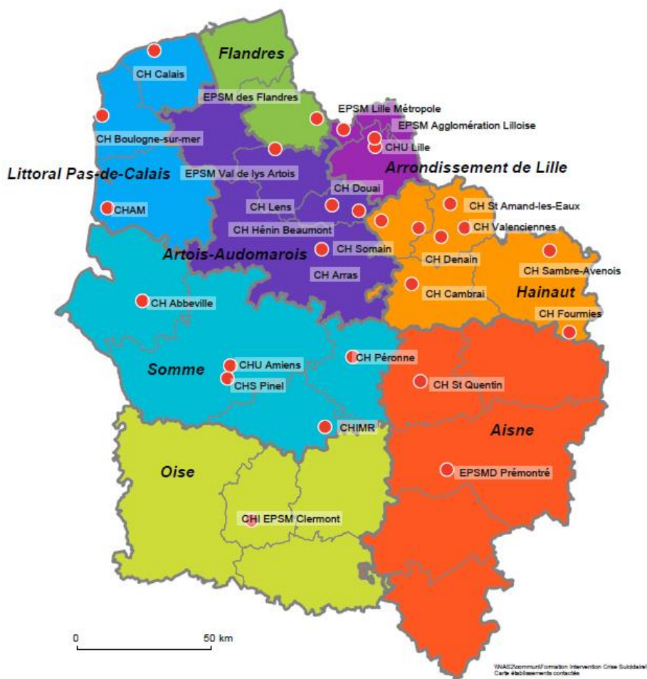
Figure 1 : Localisation des établissements de santé gérant des services de psychiatrie dans les Hauts-de-France contactés